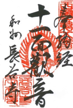
第八番札所 長谷寺