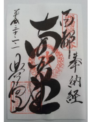
第九番札所 興福寺南円堂