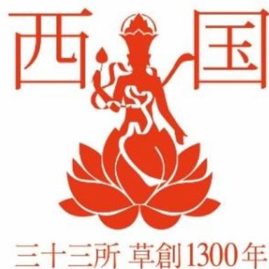
観音菩薩像をイメージした特別な御朱印

特別な御朱印を押印するのは、納経所が開いている8:30～17:00です。また11:00より本堂にて災害復興と世の安寧を願うことを目的にした法要を行います。