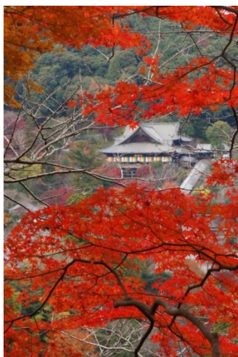
第八番札所 長谷寺

その一環として、奈良県桜井市の第八番札所「長谷寺」では、11月18日(金)の1日限定で特別な御朱印を押印する「月参り巡礼」を行います。「月参り巡礼」は、各札所において1か月ごとに行われるもので、通常の御朱印に加え、観音菩薩像をイメージした特別な御朱印を押印します。なお、長谷寺は、西国三十三所の始祖・徳道上人が開創した寺院です。