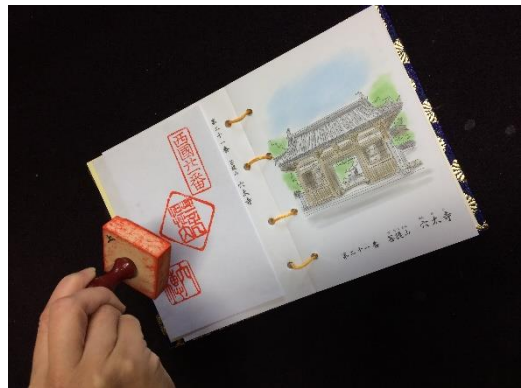
(左) 穴太寺 (右) 総持寺 江戸時代の御朱印を復刻再現