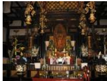
「長命寺」 本堂内陣特別拝観