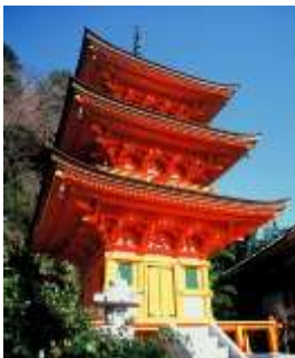
「宝厳寺」 三重の塔特別御開扉