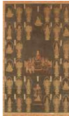
「観音正寺」 西国三十三所観音曼荼羅公開